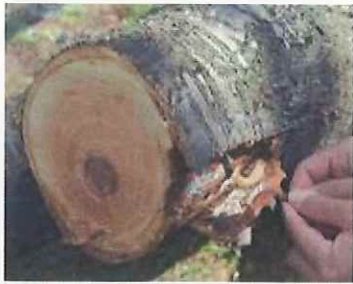
幼虫による食害（植物防疫所原図）