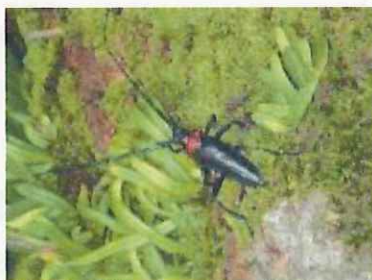
成虫（植物防疫所原図）