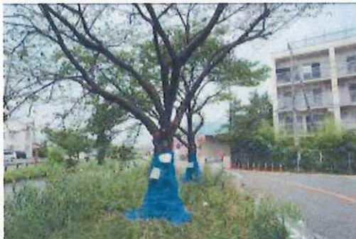
ネットを樹幹に巻き付けている様子

なお、当該種による加害が進むと、落枝、倒木等による人的被害が発生するおそれがあるため、その観点からも注意が必要。