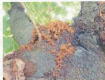
枝にたまったフラス（植物防疫所原図）